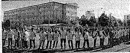
Säkerhetsvakter utanför domstolsbyggnaden.

Olof Palme international center arbetar med biståndsmiddel från Sida för att stödja det civila samhället och den demokratiska utvecklingen i Turkiet. Biståndssatsningen, som bland annat sker i samarbete med Human rights association i Turkiet och svenska Advokater utan gränser, omfattar cirka 10 miljoner kronor årligen.